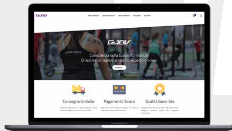
FORM DI CONTATTO

» VUOI UNA CONSULENZA PER L'ASSUNZIONE DEGLI INTEGRATORI?